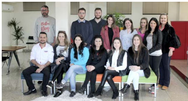
FGV Passo Fundo em Gestão Empresarial

A Cavaletti promove, constantemente, Visitas Técnicas a estudantes mostrando as instalações da empresa e proporcionando, assim, trocas de vivências e, deste modo, auxiliando na melhor preparação dos profissionais que logo estarão no mercado de trabalho.