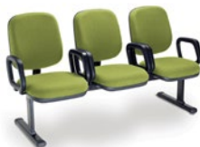
4005 Diretor Longarina