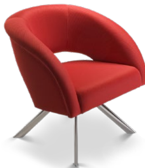
36010 Poltrona Espera Base 4 pés Fixa ou Giratória