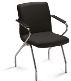
18006 Z Diretor Aproximação Estrutura Z / Braços Integrados