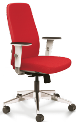
40.101 Soft Giratória Alta