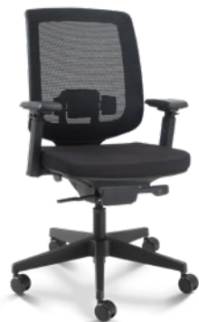
28001 Presidente Giratória

Apoio de Cabeça / Sincron RP / Braços 3D