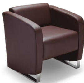
36105 Sofá Espera