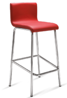
14020 Banqueta Estofada