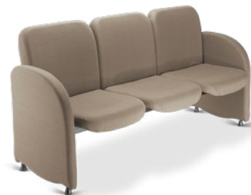
12004 Sofá Espera 3 lugares