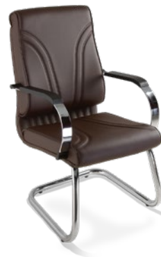
20006 Diretor Aproximação Estrutura S