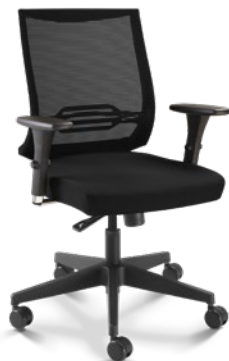
27001 Poltrona Giratória Synchron / Braços 3D / Base Nylon