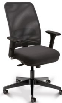
16002 Diretor Giratória Sincron / Braços 3D / Base Nylon