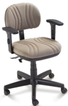
3004 Secretária Giratória