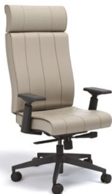
20501 Presidente Giratória

Braços Fixo Alumínio / Estrutura com rodízios frontais