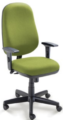
4001 Presidente Giratória