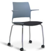
34006 P Rod Aproximação I Soft Assento Estofado com Braços e Rodízios