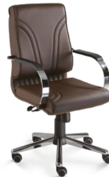
20002 Diretor Giratória Relax / Braços Fixos / Base Estampada