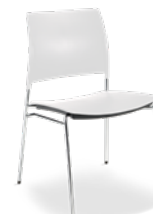
34006 P Aproximação I Basic Estrutura P