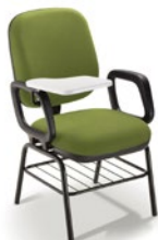
4006 PLE Diretor Universitária