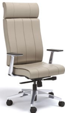
20501 Presidente Giratória

Syncron RP/ Braços Fixo Alumínio/ Base Alumínio