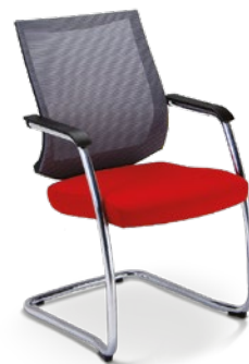
27006 SI Poltrona Aproximação Estrutura SI / Braços Integrados