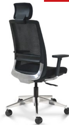
29001 AC Presidente Giratória

Apoio de Cabeça / Sincron RP / Braços 4D