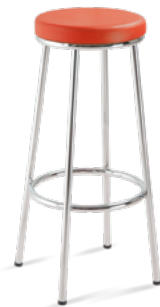
14015 Banqueta Alta *Opcional 50cm