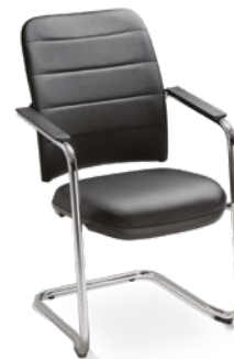
16506 S Executiva Aproximação