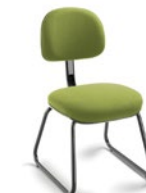
4008 A Secretária Aproximação