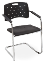
35007 S Aproximação Estrutura S / Braços Integrados