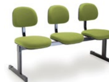
4009 Secretária Longarina