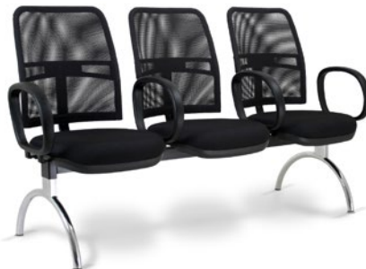
16010 Executiva Longarina Braços Corsa Intercalados