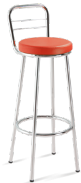
14015 Banqueta com Encosto *Opcional 50cm