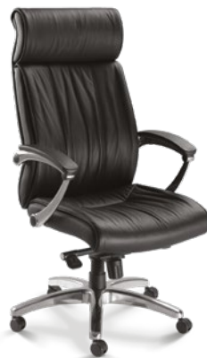
20201 Presidente Giratória Sincron Ex / Braços Articulados / Base Alumínio