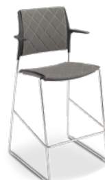
34020 Banqueta Alta I Complete Assento e Encosto Estofados com Braços