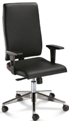
18001 Presidente Giratória