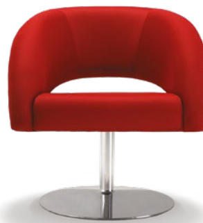
36010 Poltrona Espera Base Alumínio Giratória