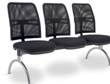
16010 Executiva Longarina