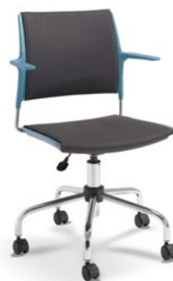
34003 Giratória | Complete Assento e Encosto Estofados com Braços

*Braços Opcionais em qualquer modelo de produto