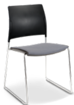
34006 Aproximação I Soft Assento Estofado