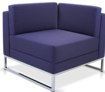
36205 Sofá Canto