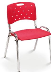
35008 P Aproximação

Estrutura Z com Rodízios / Braços Integrados