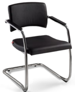
18007 S Secretária Aproximação Estrutura S / Braços Integrados