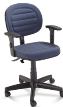
6104 Executiva Giratória