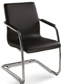
18006 S Diretor Aproximação Estrutura S / Braços Integrados