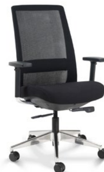
29001 Presidente Giratória