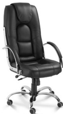
20301 Presidente Giratória Relax / Braços Fixos Estofados / Base Elíptica