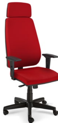
38001L AC Presidente Giratória Sincron / Braço SL / Base com Capa