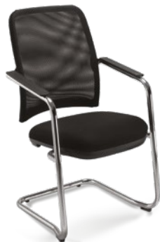
16006 S Executiva Aproximação Braços Integrados / Estrutura S