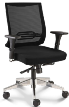
27001 Poltrona Giratória Synchron RP / Braços 3D / Base Alumínio