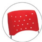
Encosto com ou sem pega-mão