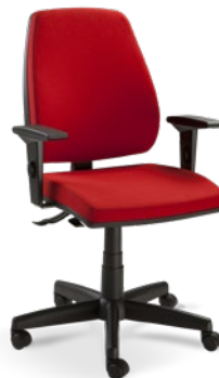
38001 Operacional Alta SRE / Braço SL / Base com Capa