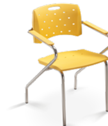
35007 Z Aproximação Estrutura Z / Braços Integrados