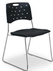
35008 A Aproximação Estrutura Arco / Emp. Máx.: 05 unidades