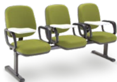
4005 UE Diretor Longarina