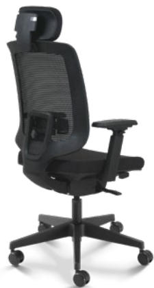
28001 AC Presidente Giratória

Apoio de Cabeça / Sincron RP / Braços 4D