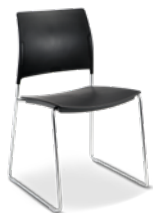
34006 Aproximação I Basic