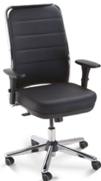
16501 Presidente Giratória