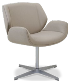
36060 Poltrona Espera Concha Revestida com Estofamento