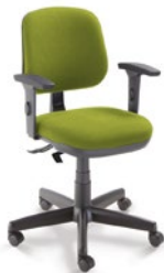
4103 Executiva Giratória

SRE / Braço SL New PU / Base com Polaina