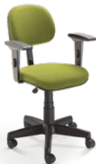
4004 Secretária Giratória

SRE / Braço SL New PU / Base com Polaina