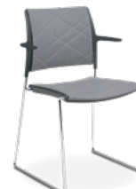
34006 Aproximação I Complete Assento e Encosto Estofados com Braços