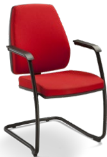
38006 SI Aproximação Alta Estrutura SI / Braços Integrados