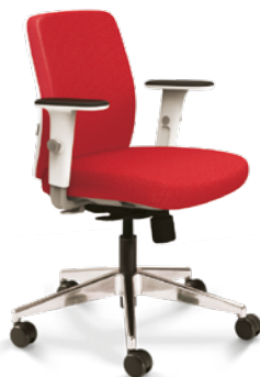
40.102 Soft Giratória Média