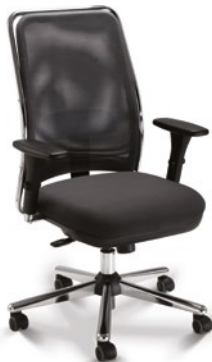
16001 Presidente Giratória Sincron / Braços 3D / Base Estampada