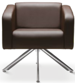
36020 Poltrona Espera