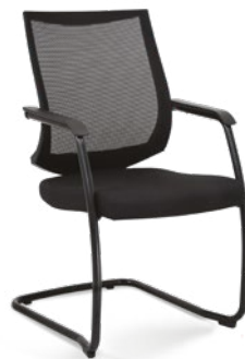
27006 SI Poltrona Aproximação Estrutura SI / Braços Integrados