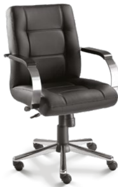
20102 Diretor Giratória Relax / Braços Fixos / Base Estampada