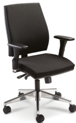
37001 Giratória Alta Sincron RP / Braços 3D / Base Alumínio