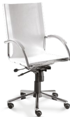
14001 Presidente Giratória Relax / Braços Integrados / Base Estampada