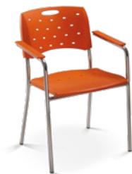
35007 P Aproximação Estrutura Palito