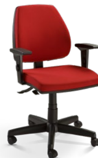
38003 Operacional Média SRE / Braço SL / Base com Capa