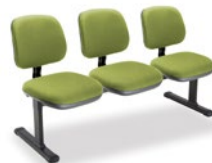
4110 Executiva Longarina