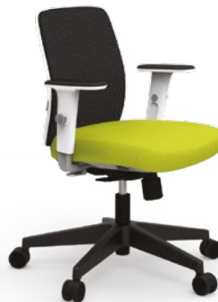
40.202 Mesh Giratória Média Sincron RP / Braços ID / Base Nylon

Mesh (Espuma de 10mm Revestida com Space)