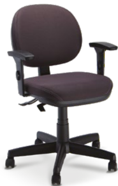
8203 Executiva Giratória