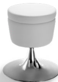
36016 Banqueta Giratória Base Alumínio