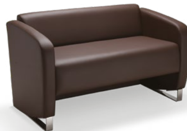
36105 Sofá Espera