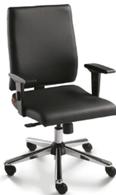
18002 Diretor Giratória