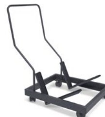
Carrinho de Transporte