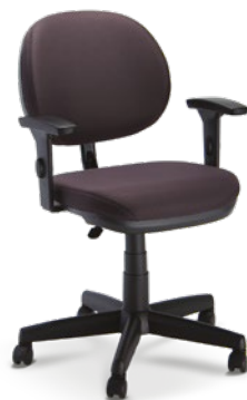
8203 Executiva Giratória

L 2048 / Braços SL New PU / Base com capa