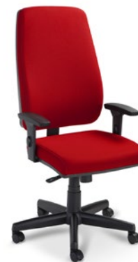
38001L Presidente Giratória Sincron / Braço SL / Base com Capa