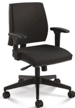
37002 Giratória Média Sincron / Braços SL New PU / Base Nylon