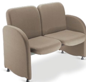
12004 Sofá Espera 2 lugares