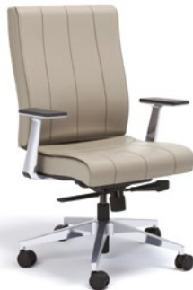
20502 Diretor Giratória

Syncron RP/ Braços Fixo Alumínio/ Base Alumínio