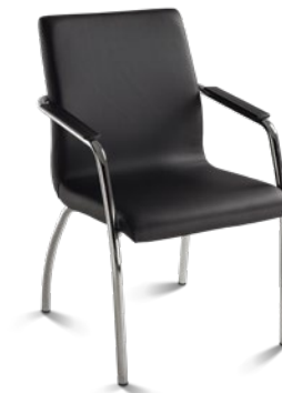
18006 P Diretor Aproximação Estrutura P / Braços Integrados