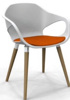
33206 Aproximação Pés de Madeira Envernizados *Opcional Estofado