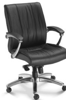
20202 Diretor Giratória Sincron Ex / Braços Articulados / Base Alumínio