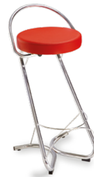
14016 Banqueta com Encosto