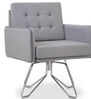
36050 Poltrona Espera Base Fixa ou Giratória