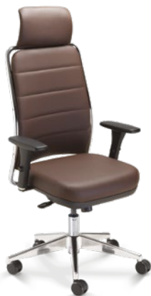
16501 AC Presidente Giratória