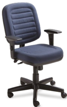
6002 Diretor Giratória