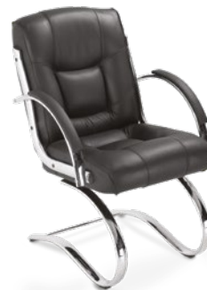
20306 Diretor Aproximação Braços Fixos Estofados / Estrutura Elíptica