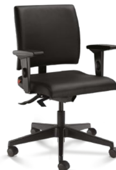
18004 Secretária Giratória