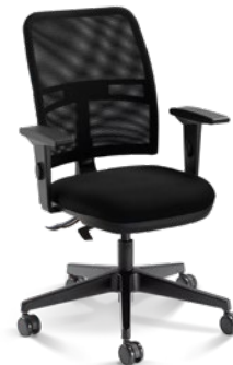
16003 Executiva Giratória SRE / Braços SL / Base Nylon