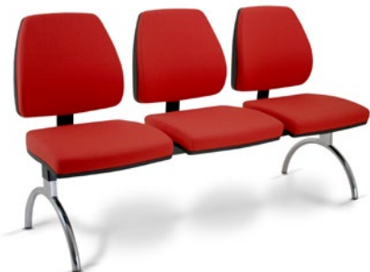
38010 Longarina Média Estrutura Cromada