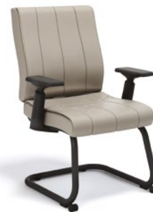
20506 S Diretor Aproximação

Braços 4D / Estrutura com rodízios frontais