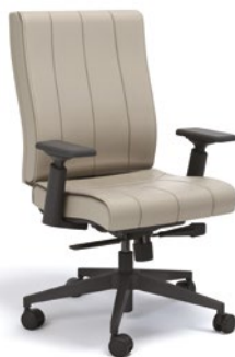
20502 Diretor Giratória