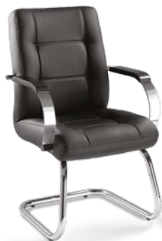
20106 Diretor Aproximação Estrutura S