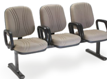
3005 Diretor Longarina