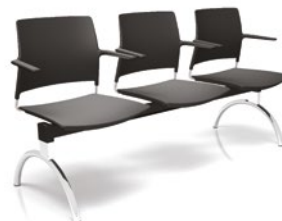
34010 Longarina I Basic