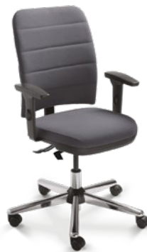
16503 Executiva Giratória