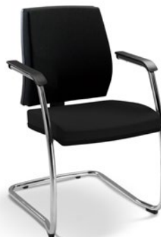
37006 Aproximação Média Estrutura SI / Braços Integrados