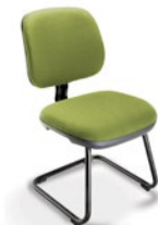
4107 S Executiva Aproximação