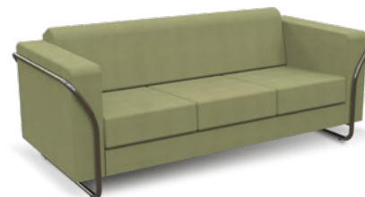
12205 Sofá Espera 1,2 e 3 lugares / Cromado