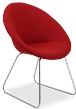
36040 Poltrona Espera Estrutura Arco