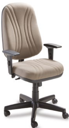
3001 Presidente Giratória