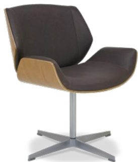
36060 Poltrona Espera Concha em Madeira com Estofamento