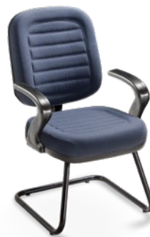
6006 S Diretor Aproximação