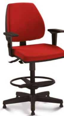
38022 Stool SRE / Braço SL / Base com Capa