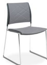
34006 Aproximação I Complete Assento e Encosto Estofados