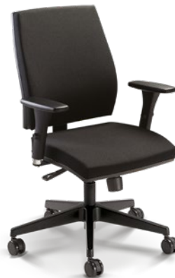
37001 Giratória Alta Sincron / Braços 3D / Base Nylon