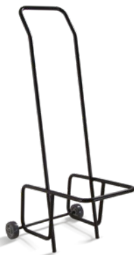
1100 Carrinho para transporte