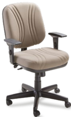
3002 Diretor Giratória