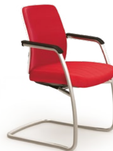
40.106 Soft Aproximação