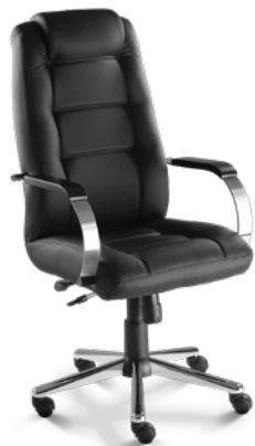
20101 Presidente Giratória Relax / Braços Fixos / Base Estampada