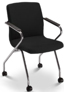
18006 Z Rod Diretor Aproximação Estrutura Z com Rodízios / Braços Integrados