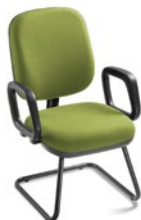
4006 S Diretor Aproximação