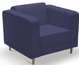
12105 Sofá Espera 1 lugar