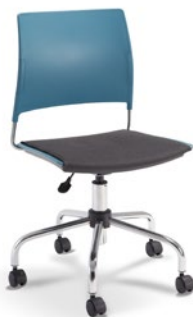
34003 Giratória | Soft Assento Estofado