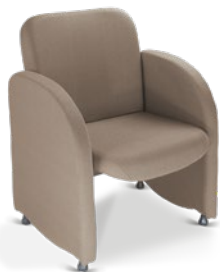
12004 Sofá Espera 1 lugar