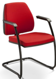
38007 SI Aproximação Média Estrutura SI / Braços Integrados