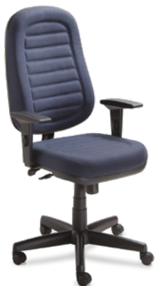
6001 Presidente Giratória