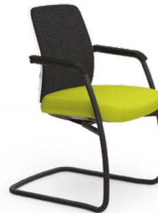
40.206 Mesh Aproximação Estrutura SI / Braços Integrados