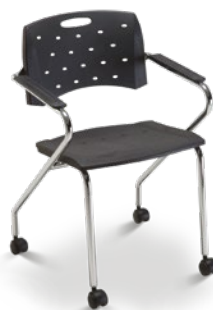
35007 Z Rod Aproximação

Estrutura Z com Rodízios / Braços Integrados