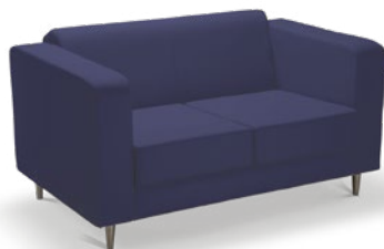
12105 Sofá Espera 2 e 3 lugares