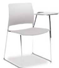
34006 U Universitária I Basic Prancheta Fixa, Dobrável ou Escamoteável