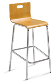
14020 Banqueta Madeira com Verniz