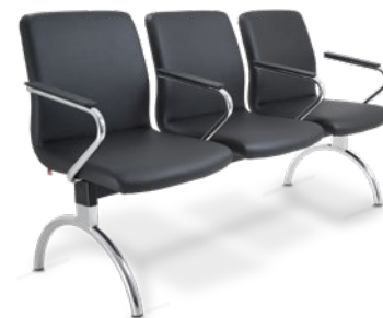
18010 Diretor Longarina Braços Z Intercalados