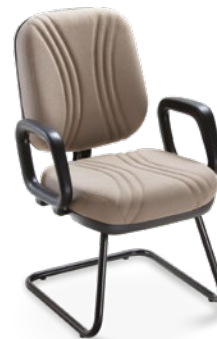
3006 S Diretor Aproximação