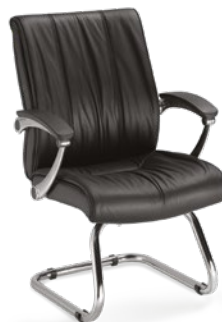
20206 Diretor Aproximação Braços Articulados / Estrutura S