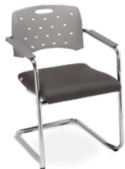
35007 SE Aproximação