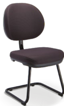
8207 S Executiva Aproximação