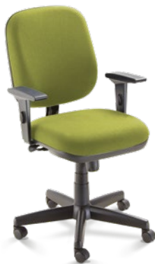
4002 Diretor Giratória