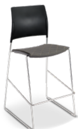
34020 Banqueta Alta I Soft Assento Estofado