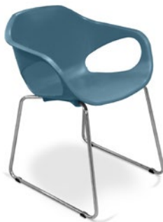
33107 A Aproximação Estrutura Arco