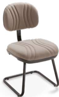
3008 S Secretária Aproximação