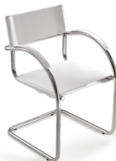
14007 S Secretária Aproximação Estrutura S / Braços Integrados