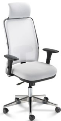
16001 AC Presidente Giratória Sincron / Braços 3D / Base Alumínio