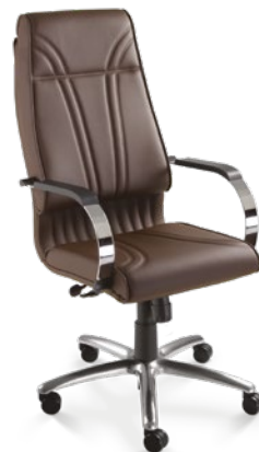
20001 Presidente Giratória Relax / Braços Fixos / Base Alumínio