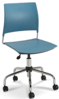
34003 Giratória | Basic