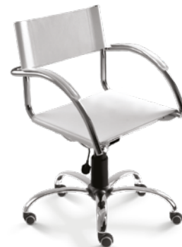
14004 Secretária Giratória BG / Braços Integrados / Base Elíptica