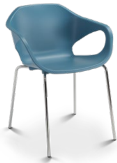
33106 P Aproximação Empilhável Estrutura Palito / Emp. Máx.: 04 unidades