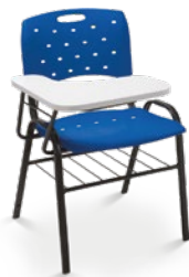
35008 PU Universitária Estrutura com grade / Prancheta Removível